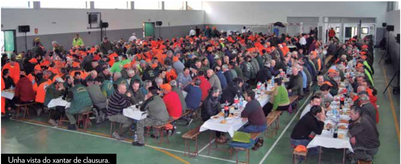
Unha vista do xantar de clausura.