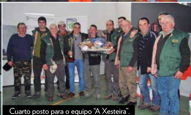
Cuarto posto para o equipo "A Xesteira".

En todo caso, a cousa non pasou a maiores. Todo quedou niso, nunha concentración e unhas protestas que estiveron en todo momento controladas por efectivos da Garda Civil, saldándose simplemente con algún que outro intercambio de impresións.