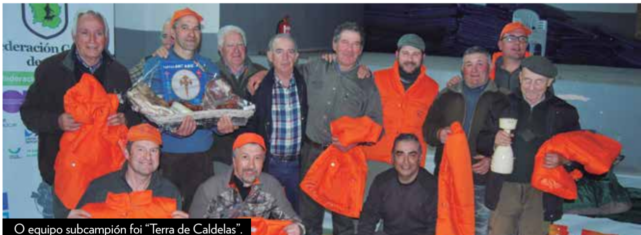
O equipo subcampión foi "Terra de Caldelas".