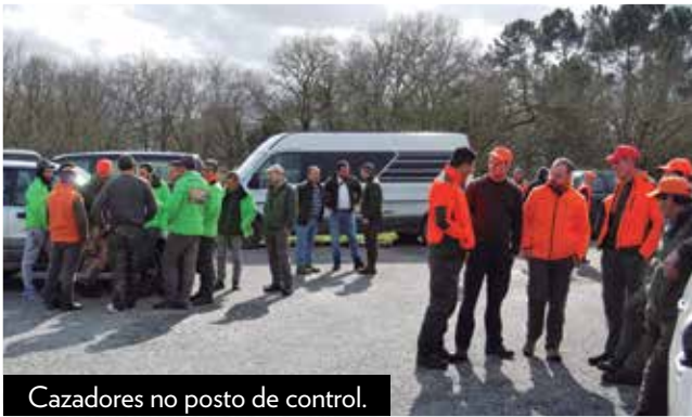
Cazadores no posto de control.