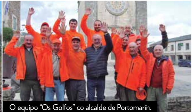
O equipo "Os Golfos" co alcalde de Portomarín.