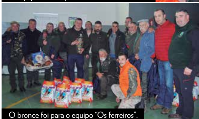
O bronce foi para o equipo "Os ferreiros".