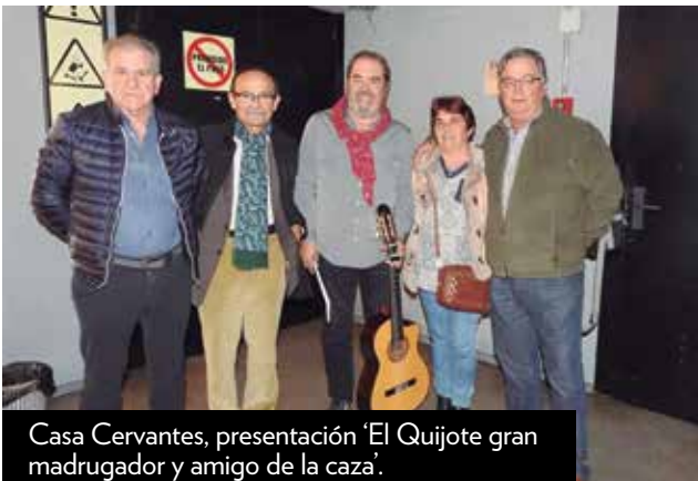
Casa Cervantes, presentación 'El Quijote gran madrugador y amigo de la caza'.