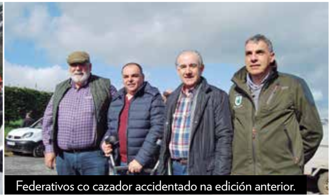
Federativos co cazador accidentado na edición anterior.