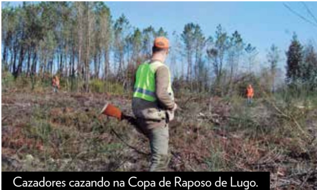
Cazadores cazando na Copa de Raposo de Lugo.